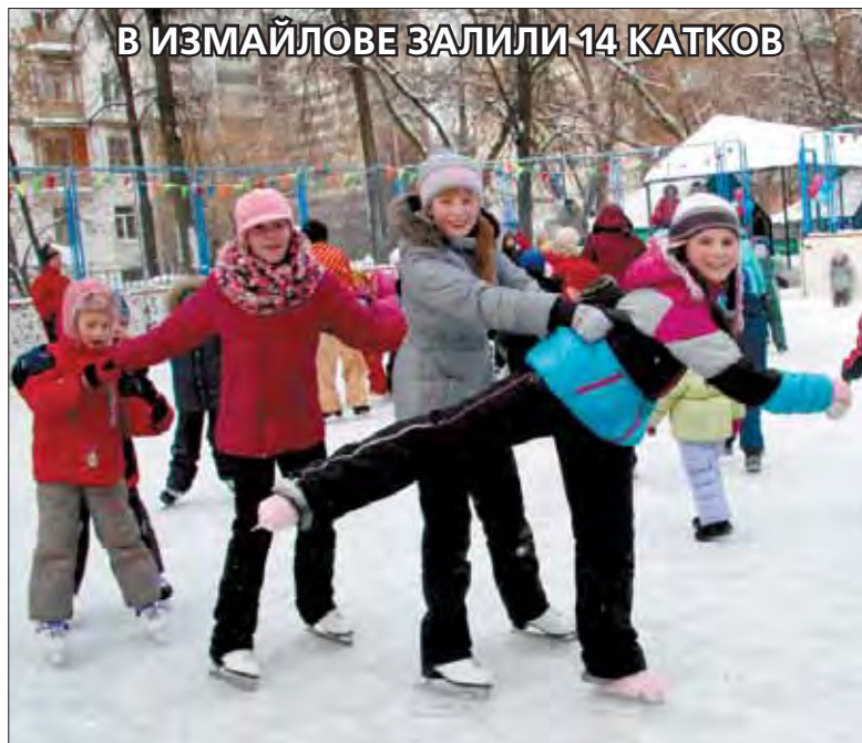
В ИЗМАЙЛОВЕ ЗАЛИЛИ 14 КАТКОВ

Измайловский бульвар, 31А, Измайловский проезд, 5, корп. 1, Измайловский проезд, 20, корп. 2, 2-я Парковая улица, 16, 7-я Пар-