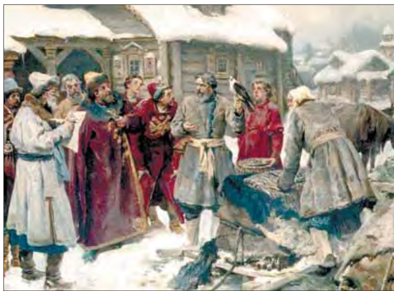
Привоз соколов и сдача подсокольничему соколов на Семёновском потешном дворе г. Москвы холмогорскими помытчиками в конце XVII столетия. Художник К.В. ЛЕБЕДЕВ. 1899 год.

Помытчики занимались ловлей диких пернатых хищников в Двинской земле, на Печоре и Кольском полуострове, на Канином носу, в Тверской стороне и Каргополе. Богатой на добычу оказалась Сибирь – места близ