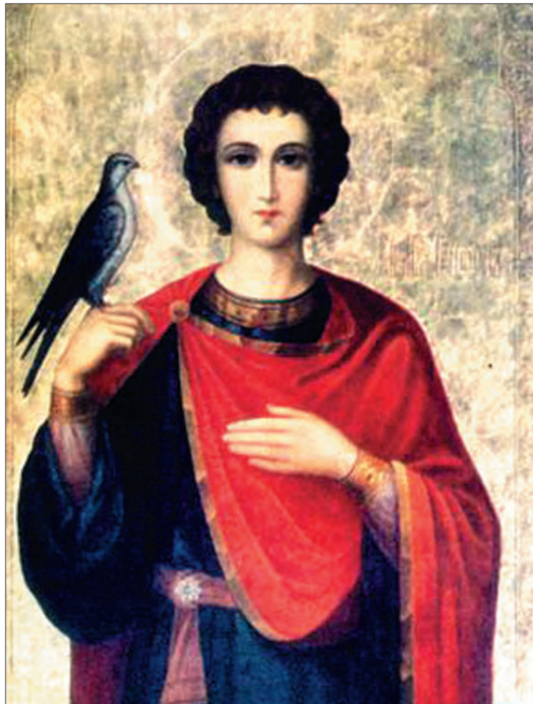
Святой Трифон – покровитель русской охоты.

убедиться в этом, заглянем ещё раз в уже упоминавшуюся выше книгу, составленную при деятельном участии государя. Это руководство под длинным, но обычным тому времени, полным заглавием: «Книга, глаголемая Урядник, новое уложение и устройство чина сокольничья пути». Посвящена она церемонии производства рядового сокольника в «начальные». В «действе» участвовал и сам царь. Его дожидались не только сокольники, но и разместившиеся на стульях крылатые «охотники». Когда появлялся государь, ему «били челом» начальник царской охоты и старшие сокольники.